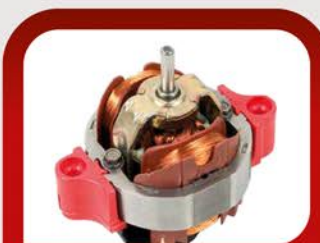
Профессиональный итальянский мотор PRO AC