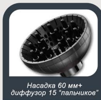
Насадка 60 мм+ диффузор 15 "пальчиков"