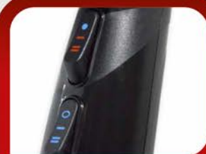
Кнопки переключения температуры и скорости