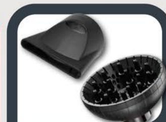
Насадка 60 мм+ диффузор 15 "пальчиков" с ионизацией