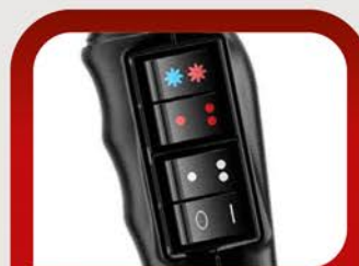
Кнопки переключения температуры, скорости и холодного воздуха