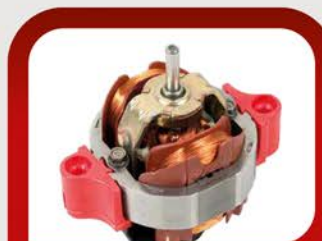
Профессиональный итальянский мотор PRO AC