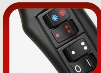
Кнопки переключения температуры, скорости и холодного воздуха