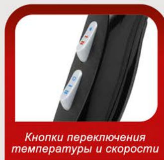
Кнопки переключения температуры и скорости