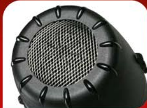
Фильтр из нержавеющей стали