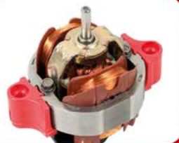
Профессиональный итальянский мотор PRO AC