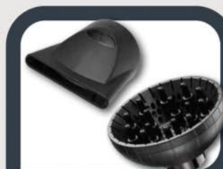
Насадка 60 мм+ диффузор 15 "пальчиков"