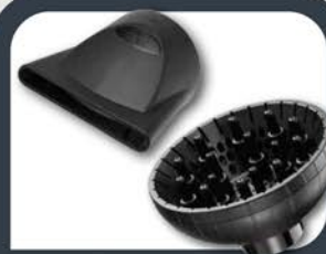
Насадка 60 мм+ диффузор 15 "пальчиков"